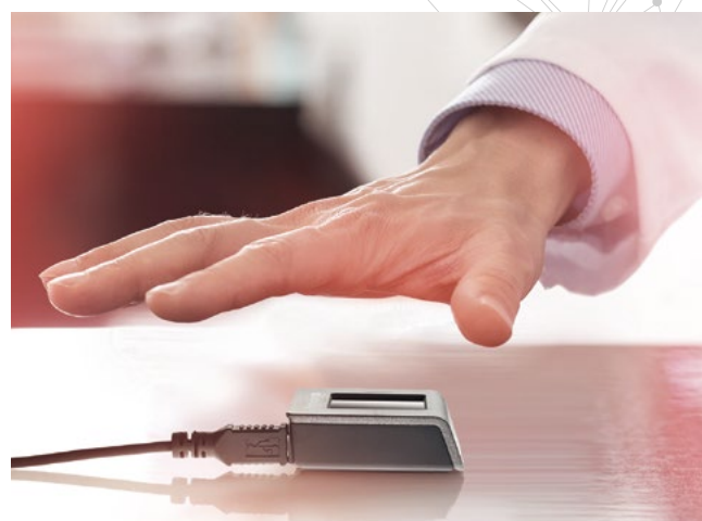
Diese Abbildung ist eine Beispieldarstellung.